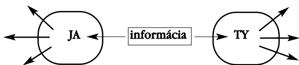
Schéma 1. Komunikácia

Schéma 1 zobrazuje jeden zo základných znakov medziľudskej komunikácie. Diskutujúci sú v sebe uzavretí, a teda chránení nepriepustnou vrstvou vzájomného odstupu. Informácia touto ochranou dokáže prejsť, čím vecne zasahuje do intimity vnútorných svetov diskutujúcich a môže ovplyvniť ich osobnosť. Spracovaná informácia sa potom transformuje do sveta samostatne a zvlášť. Vzájomná izolácia chráni pred ovplyvnením, čím vzniká do istej miery „čisté“ osobné rozhodnutie s jasnou mierou osobnej zodpovednosti. Ako ukazuje schéma, v centre stojí informácia, diskutujúci sú akoby vedľajší.